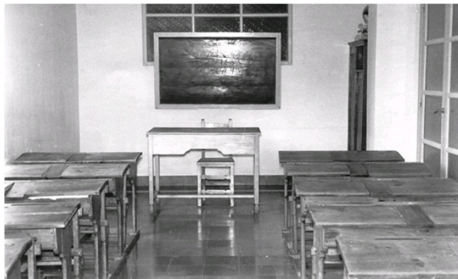
Foto1: Aula para 20 alumnas en pupitres bipersonales

La creación de la Escuela de Enfermería de Jaén, en el año 1954, se produce en un momento que podríamos calificar como histórico en la configuración de los estudios de enfermería en España. En 1953, mediante el Decreto de 4 de diciembre de este mismo año, se unifican los títulos de practicantes, enfermeras y matronas en el de Ayudantes Técnicos Sanitarios (ATS). Este hecho dio lugar a la reorganización de los estudios de enfermería desarrollados hasta este momento.